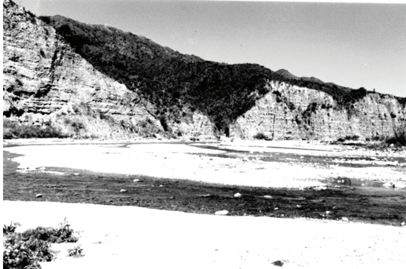
Figura 3 - El banco de arroyo serrano

Es decir, que la sociedad requiere que las tres actividades se lleven a cabo sin renunciamiento alguno.