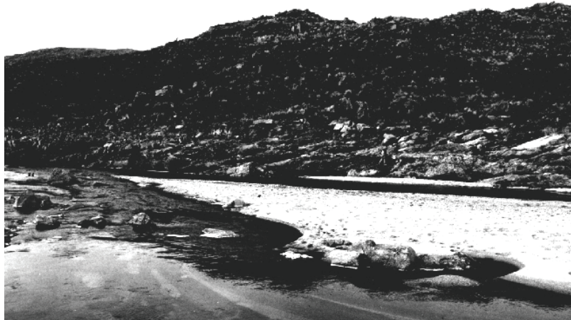
Figura 2 - El típico río serrano

Se ha aclarado que si se elimina el área de aporte, este tipo de yacimiento deja de ser "renovable". Sin embargo, si se trabaja dentro de ciertos parámetros, esta industria puede ser, entre las mineras, una de las de mayor posibilidad de encarar dentro del desarrollo sustentable.