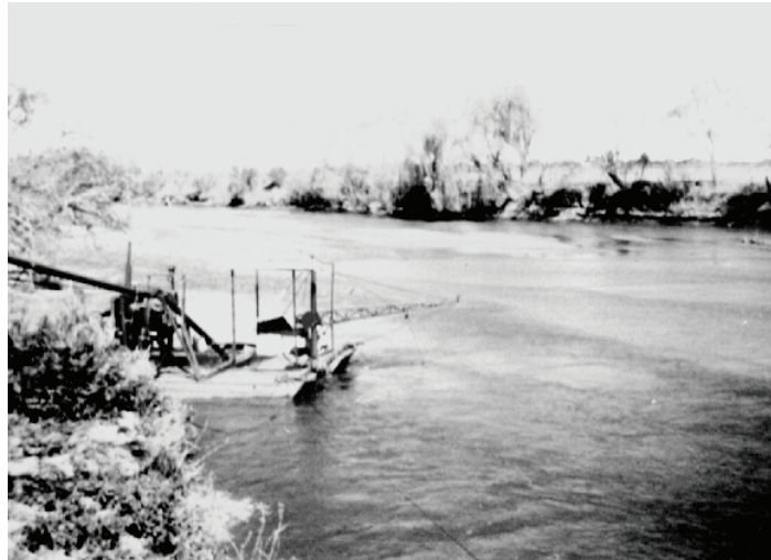
Figura 3 - Banco sumergido en ríos de llanura