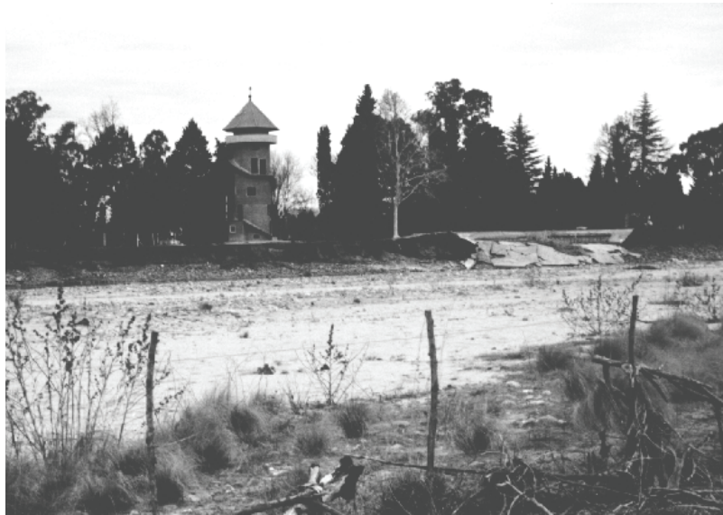
Figura 5 - La expoliación

factores externos que arman el escenario donde la industria se desenvuelve.