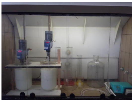
Figura 4. Condicionamento do solvente.

Para a primeira fase da extração das terras raras pesadas, após diversos testes, os melhores resultados foram compostos pelo solvente orgânico aliquat 336 20% em solvesso, condicionado o solvente com ácido nítrico 2M, 1:1 aquoso/orgânico, por 4 horas de contato e posteriormente duas lavagens de 30 minutos com água deionizada.