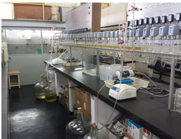
Figura 1. Foto do circuito em contracorrente na unidade contínua de extração por solvente.

A Figura 1 demonstra a operação da unidade contínua de extração por solvente na primeira etapa de extração das terras raras pesadas, utilizando também etapas de lavagem e reextração para recuperação do solvente.