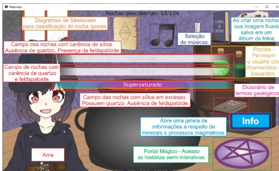
Figura 2. Interface principal do aplicativo Magmágica .

O aplicativo também conta com um pequeno dicionário de termos geológicos com pelo menos 50 vocábulos. Oito estórias interativas estarão disponíveis, ao longo das quais o usuário necessita responder questões e criar determinadas rochas para prosseguir. Os contos acompanham as protagonistas Ame (Geóloga Forense) e Cyan (Bruxa), e suas interações com um caldeirão mágico, responsável por criar as rochas. Tais contos abordam temas não apenas relacionados a geologia, como também de outras áreas do conhecimento como história, física e química.