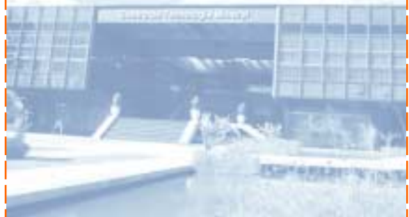
Centro de Tecnologia Mineral - CETEM Av. Ipê, 900 - Ilha da Cidade Universitária - 21941-590 - Rio de Janeiro - RJ

OBS. EM ALGUNS CASOS, O CETEM DEVERÁ COBRAR CUSTOS RELACIONADOS À PUBLICAÇÃO E/OU REMESSA.