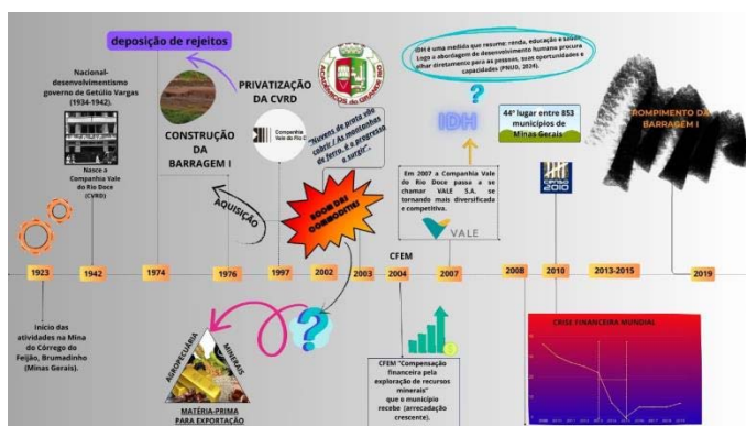
Figura 1. Infográfico Linha do Tempo. Elaboração própria.

O infográfico “Linha do tempo” (Figura 1) descreveu os fatos históricos e econômicos da atividade mineradora no território, a construção da Barragem I pela empresa “Vale do Rio Doce”, bem como a privatização da empresa se tornando a VALE S.A., até o momento do rompimento da Barragem I e das barragens IV e IV-A.