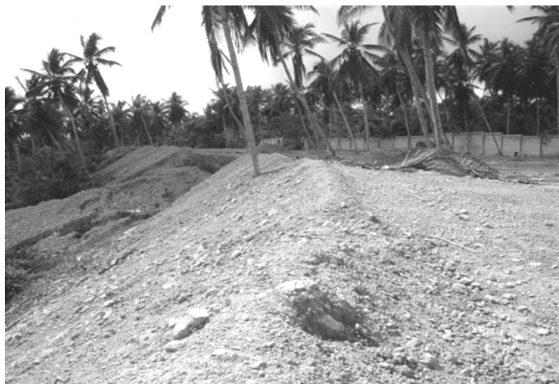
Depósitos de rockash en Samaná