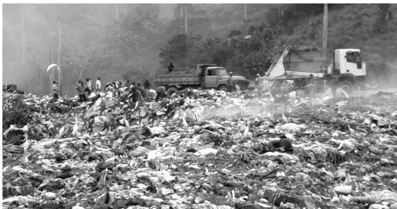
Vertedero municipal de Puerto Plata

Esto generaría cientos de empleos dignos, mejoraría la calidad de vida en sectores marginados, facilitaría que miles de pequeños empresarios puedan acceder a fuentes de materias primas baratas y renovables, disminuiría en alrededor de un 75% la disposición final de las basuras, permitiría cubrir parte de los costos de recolección y transporte de las basuras y reduciría significativamente la contaminación ambiental por disposición de desechos sólidos.