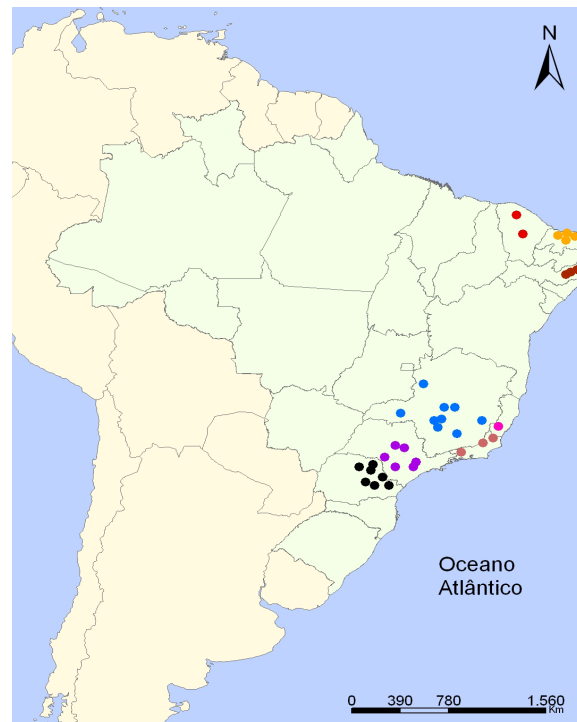
Figura 3. Localização dos Principais Produtores de Cal no Brasil.

Na região Nordeste, encontra-se 6% da oferta brasileira de cal. O Rio Grande do Norte destaca-se como grande produtor dessa região, com destaque para a região de Mossoró, Baraunas, Currais novos e Apodi, onde médios produtores convivem com pequenos e micros muitas vezes produzindo na clandestinidade. O Ceará também registra produção de cal, no município de Altaneira, localizada no Cariri Oeste, tem como principal fonte de renda a produção de cal, onde os moradores encontram uma fonte de renda para sustentar suas famílias.